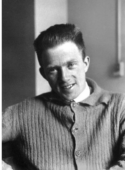
Abbildung 4: Werner Heisenberg in den 1920er Jahren

Als Bohr im Sommer 1922 in Göttingen seine als “Bohrfestspiele” bekannt gewordenen Vorträge zu diesem Problemkreis hielt, war Heisenberg aus München angereist und stellte als sehr junger Mann Bohr kritische Fragen. Nach seiner Promotion in München kam Heisenberg 1924 als weiterer Assistent von Born nach Göttingen.