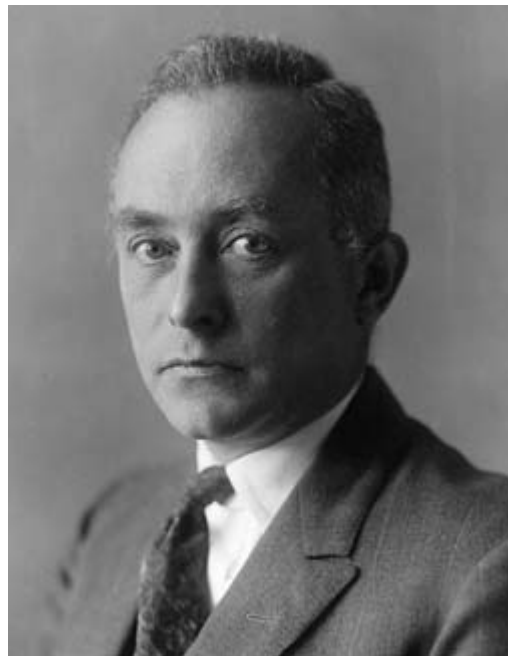
Abbildung 2: Max Born in den 1920er Jahren

Im Jahr 1921 hatte Max Born nach dem Weggang Peter Debyes aus Göttingen den Ruf auf den neu geschaffenen Lehrstuhl für Theoretische Physik angenommen. Born hatte von 1915 bis 1919 in Berlin ein Extraordinariat inne gehabt. Dort war er in Kontakt mit Max Planck und Albert Einstein gekommen, mit letzterem hatte er bis zu dessen Tod im Jahr 1955 ein enges freundschaftliches Verhältnis. Von 1919-21 war Born Ordinarius in Frankfurt (Main).