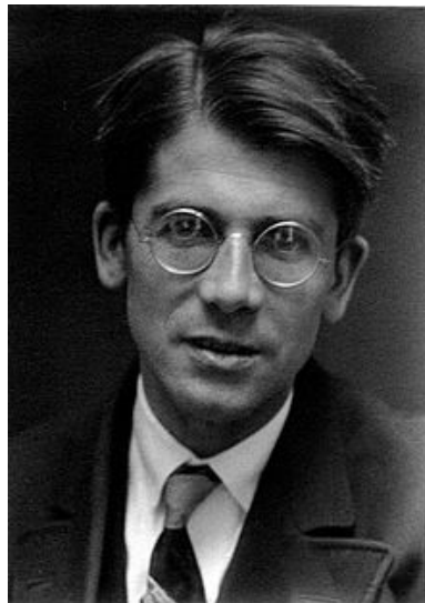
Abbildung 3: Friedrich Hund in den 1920er Jahren

Im Jahr 1921, in dem Born nach Göttingen kam, legte der 1896 geborene Friedrich Hund in Göttingen sein Staatsexamen in Mathematik, Physik und Geographie ab, um Gymnasiallehrer zu werden. Er zog es aber dann doch vor, in der Wissenschaft bleiben. Nach der Promotion im Jahr 1922 wurde er Assistent bei Max Born. In dieser Zeit war er zum Einen am Versuch der Erweiterung der Hamiltonschen Mechanik zu einer "Atommechanik" beteiligt, zum Anderen beschäftigte er sich intensiv mit den experimentellen Spektren von Mehrelektron-Atomen und fand 1925 dabei empirisch seine berühmt gewordene Hundsche-Regel [4].