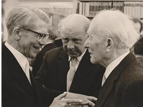
Abbildung 5: Hund, Heisenberg und Born bei Hunds siebzigsten Geburtstag